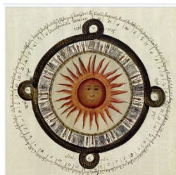
古代メキシコのカレンダー